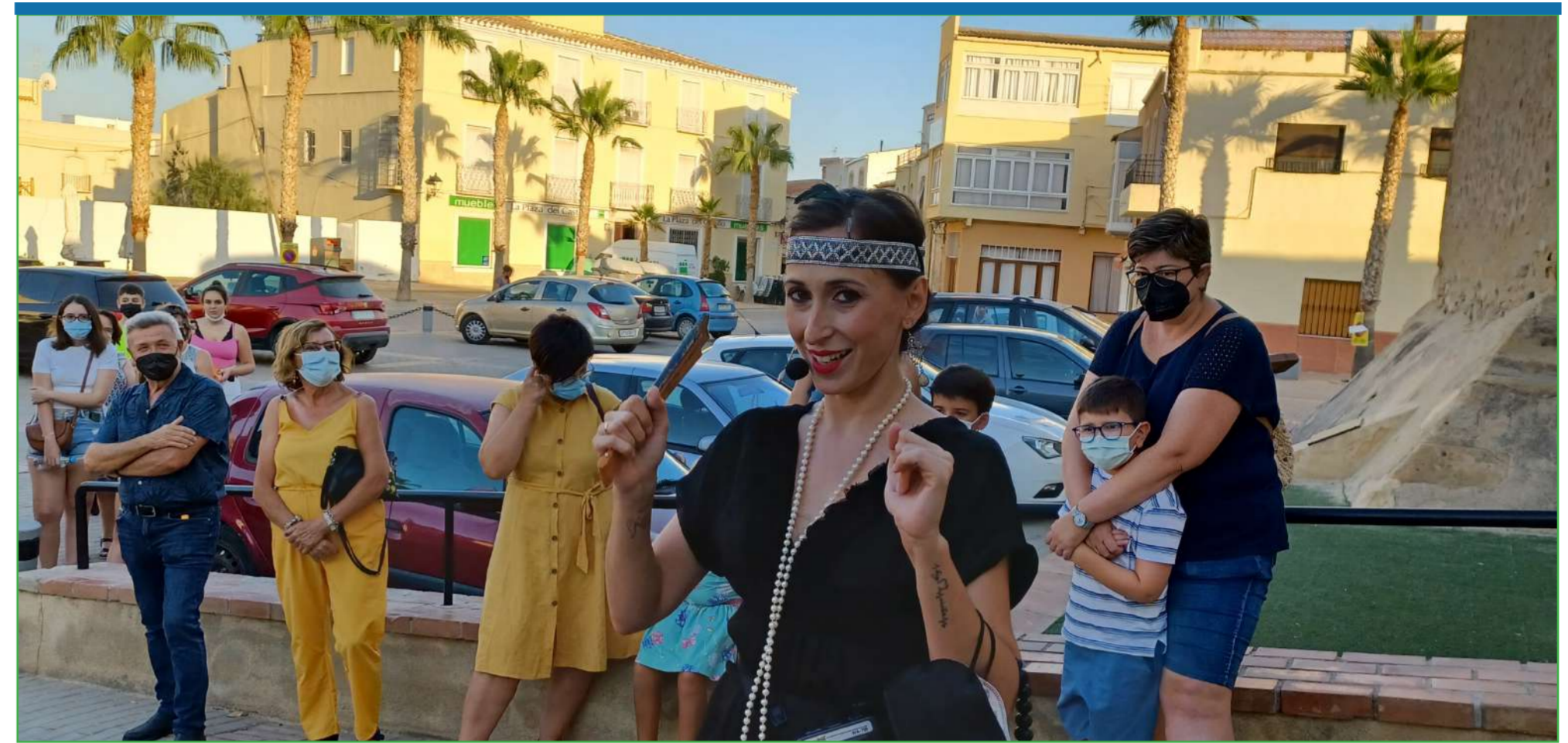
La Bella Dorita guió una visita teatralizada muy especial en el Castillo del Marqués de Los Vélez.