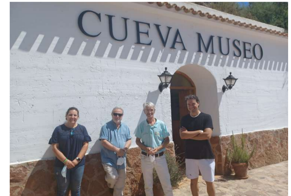
El actor Manuel Galiana visitó la Cueva Museo y otros lugares de interés cultural de Cuevas.

En definitiva, un verano de 10 que atrajo a miles de visitantes.